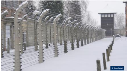
Fördermöglichkeiten für schulische Gedenkstättenfahrten | Bildungsportal NRW