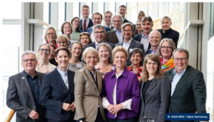
Kooperationen mit außerschulischen Partnern im Ganzttag stärken