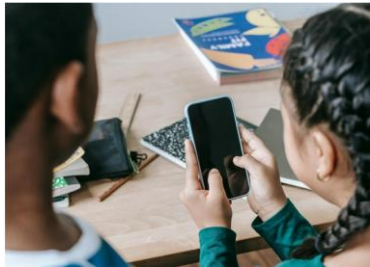
Demokratie on demand